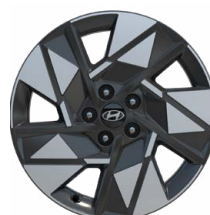
18" kola z lehké slitiny