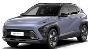
Meta Blue Pearl Perleťová Kombinace dostupná také s černým lakováním střechy Cena: 17 900 Kč