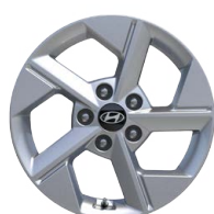
16" kola z lehké slitiny