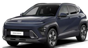
Denim Blue Pearl Perleťová Kombinace dostupná také s černým lakováním střechy Cena: 17 900 Kč