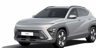
Shimmering Silver Metallic Metalická Kombinace dostupná také s černým lakováním střechy Cena: 17 900 Kč