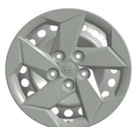
16" ocelová kola s celoplošnými kryty