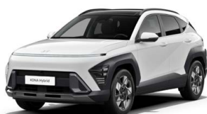
Atlas White Pastelová Kombinace dostupná také s černým lakováním střechy Cena: 9 900 Kč