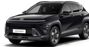
Abyss Black Pearl Perleťová Cena: 17 900 Kč