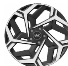
Unikátní N Line 18" kola z lehké slitiny