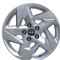
17" kola z lehké slitiny