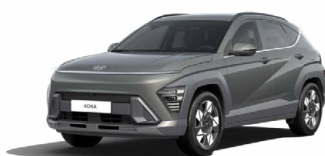
Amazon Gray Metalická Kombinace dostupná také s černým lakováním střechy Cena: 17 900 Kč