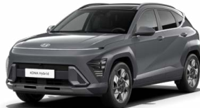
Ecotronic Gray Pearl Perleťová Kombinace dostupná také s černým lakováním střechy Cena: 17 900 Kč