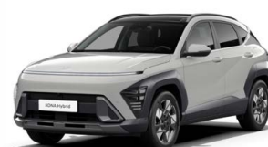
Cyber Gray Metallic Metalická Kombinace dostupná také s černým lakováním střechy Cena: 17 900 Kč