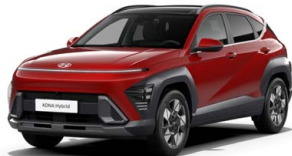
Ultimate Red Metallic Metalická Kombinace dostupná také s černým lakováním střechy Cena: 17 900 Kč