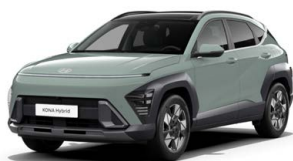
Mirage Green Pastelová Kombinace dostupná také s černým lakováním střechy Cena: 0 Kč